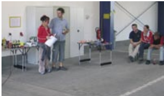
Siegerehrung zur „Rallye der Vernunft“. Pokale und Präsente stellten Sponsoren zur Verfügung.

Da gibt es einen Stopp mit Verkehrskontrolle. Oder eine Geschicklichkeitsprüfung ist zu bewältigen. Einparken in eine Lücke, selbst für manchen gestandenen Autofahrer vielleicht noch ein Problem. Slalom- und Spurbrettfahren gehören ebenso zu dieser Übung. Dann kommen die Teams unterwegs an eine Unfallstelle. Wie verhalte ich mich richtig? Was ist zuerst zu unternehmen?