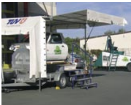
Der TÜV gehört zu den langjährigen Partnern der RBA, auch bei der „Rallye der Vernunft“.

J unge Autofahrer im Alter von 18 bis 25 Jahre werden häufiger in Unfälle verwickelt als andere Verkehrsteilnehmer. Ein Grund für die Polizeistation Arnstadt, die örtliche Verkehrswacht und u. a. die RBA Regionalbus Arnstadt GmbH als Sponsor, zum dritten Mal eine „Rallye der Vernunft“ zu veranstalten.