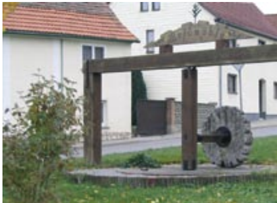
Dorfmitte in Neckeroda

Der aktive und mobile Mensch des 21. Jahrhunderts kann diese Wegstrecke zwischen Weimar und Großkochberg natürlich auch zu Fuß zurücklegen, aber einen Teil davon bequem und sicher mit dem Omnibus fahren. Die Linie 221 von Weimar nach Rudolstadt und zurück kreuzt den „Goethewan-