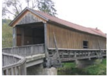
Historische Holzbrücke über die Ilm in Buchfart