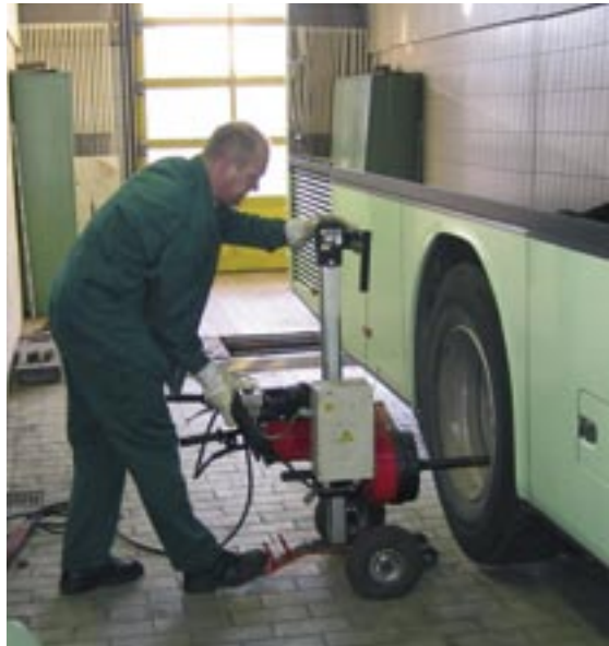
In der Werkstatt der RBA werden die Busse rechtzeitig auf den Winter vorbereitet.

Gerade im Winter steht immer wieder die Frage: Wann ist eine Straße befahrbar? Das ist letztendlich die Entscheidung des Omnibusfahrers. Natürlich spielen Fahrbahnbeschaffenheit und mögliche Gefällstrecken eine Rolle. Sind die Straßen von Laub oder Schnee ordentlich beräumt? Aber die erfahrenen Omnibusfahrer der RBA Arnstadt kennen ihre Linien und die Straßen sehr gut, geben über Funk ihren Kollegen auch manche aktuellen