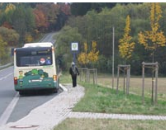
Haltestelle der Linie 221 bei Saalborn

In Weimar, am Ausgangspunkt unserer Reise zu Fuß oder per Bus, lohnt immer ein Besuch der Dichterstätte am Frauenplan und der vielen anderen Sehenswürdigkeiten. Heraus aus der Stadt, über die Amalien- und Rilke-Straße, nach Vollersroda, ein 1262 erstmals urkundlich erwähntes Dorf. Weiter geht es nach Buchfart, wobei bergab ein herrlicher Blick ins Mittlere Ilmtal den Wanderer entschädigt. Die idyllisch gelegene Gemeinde ist bekannt durch ihre sehenswerte überdachte Holzbrücke über die Ilm von 1818, die Dorfkirche mit dem wertvollen Flügelaltar von 1492 und die Felsenburg mit 15 in den Stein eingehauenen Kammern.