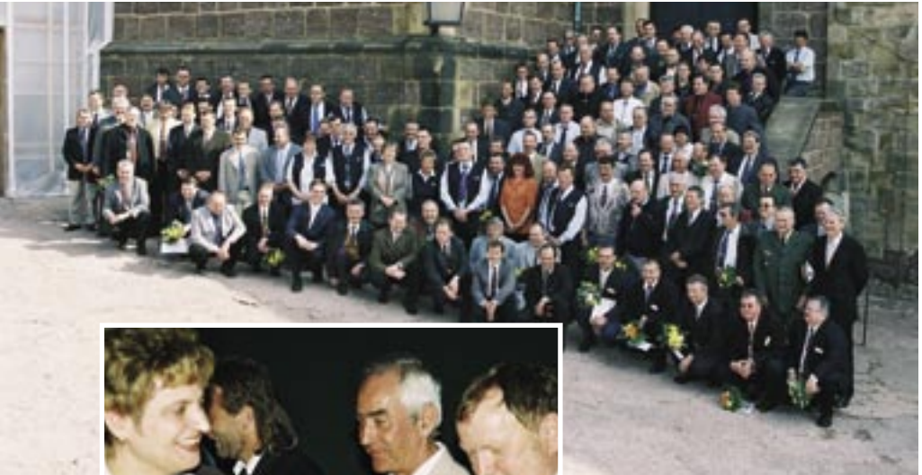
Auszeichnung von 120 sächsischen und thüringischen Linienbusfahrern im April 2004 auf der Wartburg.