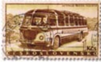
Typische Trambus-Bauweise (Tschechoslowakei) auf einer Briefmarke, 1960

fand Ende Mai 2005 ein Treffen historischer Postomnibusse statt, von denen es noch rund 30 in Deutschland gibt.