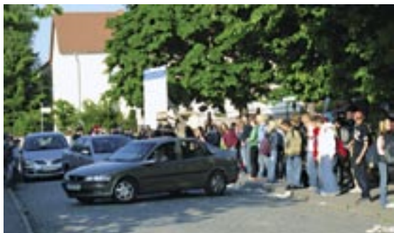
Waghalsige Wende. Bald nicht mehr möglich vor der Schule.

Bus und PKW. Die schmale Schulstraße in Stadtilm wird zur Einbahnstraße umgewidmet.