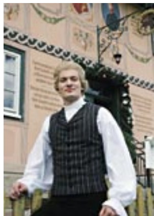
Vor dem Gasthof „Zum braunen Roß“ in Bauerbach, wo Schiller noch heute Schulden hat.

Die Einsamkeit von Bauerbach wurde nur unterbrochen durch die gelegentlichen Wanderungen nach Meiningen, weil Schiller dort Bücher, Schreibpapier und Tinte für seine Arbeit bekam, aber auch „guten Schnupftoback“. Eine Kutsche kann-