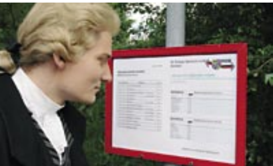
Schiller schaut auf den Fahrplan mit dem Schillerbus.

Irgendwie passt der Mann nicht in die Zeit und in die Landschaft. Mit Gehrock und gepudertem Haar. Er steht in Bauerbach an der Bushaltestelle, schaut auf den Fahrplan und wartet. Wie die anderen rund 30 Wanderer.