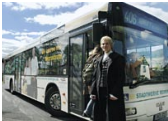
Bitte einsteigen in den Schillerbus.

Wer noch zur Sommerzeit den Weg nach Bauerbach findet, dem sei ein Besuch im Naturtheater Friedrich Schiller empfohlen, das etwas außerhalb des Ortes liegt. Das ganze Dorf spielt dort seit 1959 Theater, vor allem Schillers Stücke. In diesem Sommer stand „Die Jungfrau von Orleans“ auf dem Spielplan. Ende August, Anfang September folgen noch vier Aufführungen von Umberto Eco's „Der Name der Rose“. Bereits Mitte August haben Künstler entlang des Schiller-Wanderweges