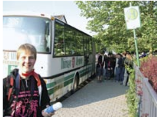
Mehr Übersichtlichkeit. Durch mehr Haltestellen vor den beiden Schulen.