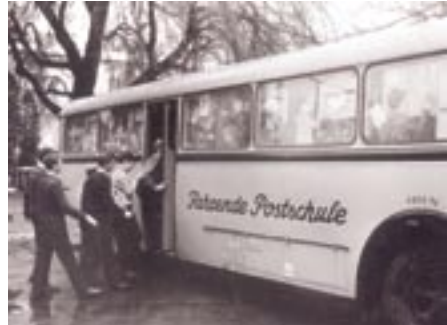
Ein Postbus als fahrende Postschule, 1959–1974