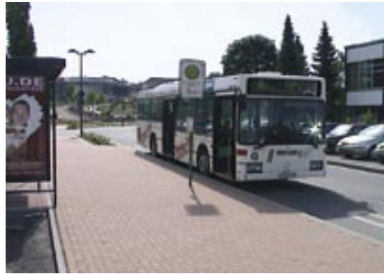
Haltestelle Mensa. Das preiswerte Bussemesterticket findet unter den Studenten keine Zustimmung.

Der für diese Leistungen angebotene Preis von 12,50 Euro pro Semester ist äußerst günstig, wie folgende Vergleiche beweisen. Ein ermäßigtes Monatsticket für Studierende kostet aktuell 14,95 Euro, eine Einzelfahrt 0,90 Euro. Das heißt, nach