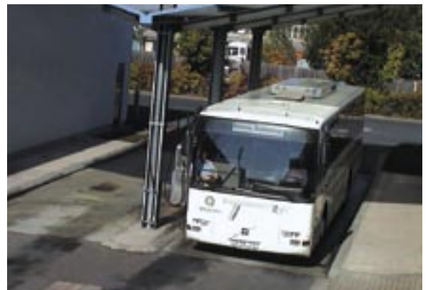
Tanken. Spezielle Kraftstoffe, die bis -22 °C ein problemloses Starten ermöglichen.

den Morgen, wie alle anderen Busunternehmen auch. Die Busse fahren auch garantiert mit Winterreifen, deren Profil und Profiltiefe bei Matsch und Schnee eine sichere Fahrt ermöglichen.