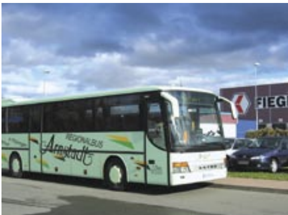
Verlängert. Die Linie 351 fährt künftig die Gewerbegebiete in Kornhochheim und Apfelstädt an.

Bisher endete die Linie 351 im Gewerbegebiet Thörey. Mit dem Fahrplanwechsel werden die Gewerbegebiete Kornhochheim und Apfelstädt bedient, wo Großunternehmen wie Rewe und Fiege ihre Firmensitze mit Hunderten von Arbeitsplätzen haben.