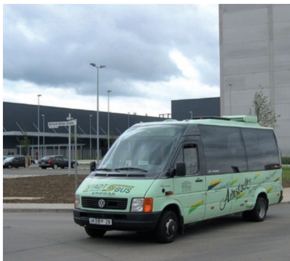
Die Busse der RBA verkehren im Stundentakt von 4 bis 22 Uhr ins Gewerbegebiet.

mit mehreren hundert neuen Mitarbeitern haben sich seitdem im Gewerbegebiet Arnstadt-Nord angesiedelt, die Expansion geht mit atemberaubendem Tempo weiter. Diese Entwicklung ist für die RBA nun Anlass, eine neue Buslinie mit veränderter Linienführung mit dem Fahrplanwechsel am 26. August zu starten.