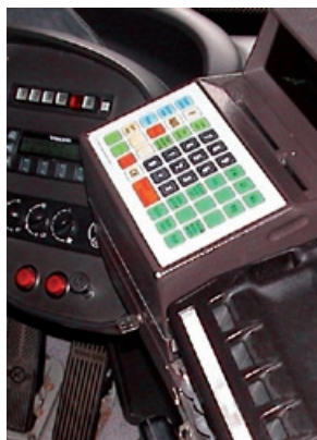
Bald ausgedient. Alte Fahrscheindrucker werden ab November durch moderne Geräte ersetzt.

Sprechfunk, modernisiert. Durch die schwierige topographische Lage im südlichen Ilm-Kreis und um einen sicheren Empfang zu gewährleisten, wird die IOV einen speziellen Sendemast auf dem Kichelhahn weiter nutzen können. Künftig kann der Fahrtverlauf