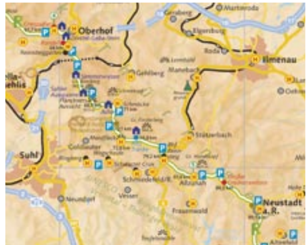
Ein Ausschnitt aus der neuen Rennsteigkarte. Die gute Erschließung der Region durch den Omnibus-Nahverkehr wird deutlich.