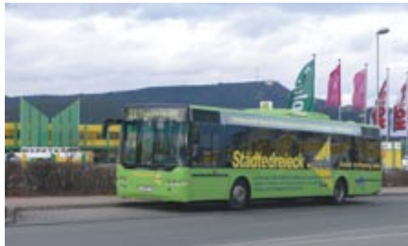
Das Saalfelder Gewerbegebiet „Am Mittleren Watzenbach“ ist mit den Städtedreieck-mobil- Linien S1, S2, B und C gut erreichbar.

► An der Bushaltestelle im Gewerbegebiet Saalfeld warten an diesem Nachmittag etwa 15 Fahrgäste. Die meisten tragen große Einkaufstüten, sie wollen nach Hause fahren.