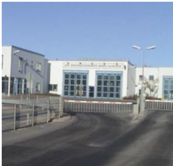
Der Firmensitz der IOV. Die Mitarbeiter und ihr Chef stehen auch in schwierigen Zeiten für den ÖPNV fest auf dem Boden der Tatsachen.

1,6 Millionen Gesamtlinienkilometer. Das entspricht einer Strecke zweimal zum Mond und zurück nach Ilmenau. Im Ernst: Diese Zahlen machen deutlich, wie sich die IOV unter schwieriger gewordenen