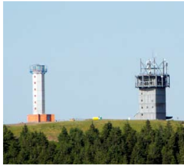
Der neue Schneekopfturm (links) mit Aussichtsplattform in 1001 Meter Höhe.

Die Stahlkanzel des Turmes erinnert in ihrer Form an einen Bergkristall. An der Außenseite des Turmes sind Haltegriffe angebracht, so