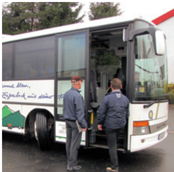
Die IOV-Kontrolleure steigen unterwegs an den Bushaltestellen zu.

► Die erste Kontrolle der neuen mobilen Einsatztruppe der IOV war sehr erfolgreich. Innerhalb von nur vier Stunden erwischte sie mehr als 20 Schwarzfahrer.