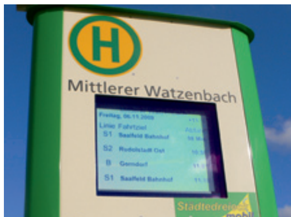
Die neuen Terminals zeigen die tatsächlichen Abfahrtszeiten der Linienbusse an.

► Die Situation hat jeder Fahrgast schon mal erlebt: In drei Minuten soll der Bus abfahren, aber er kommt nicht laut Fahrplan an.