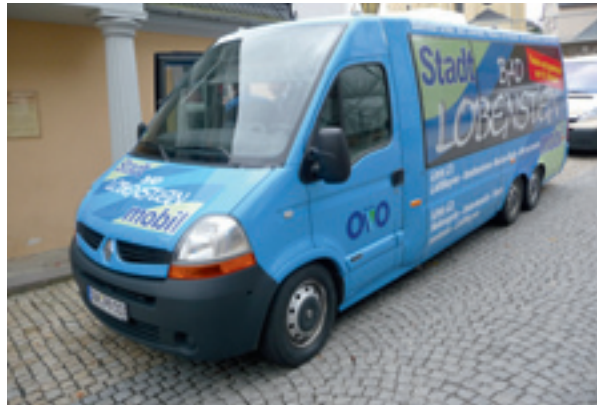
Start mit neuem Kleinbus durch Bad Lobenstein.

Nach dem Städtedreieck mobil in Rudolstadt, Saalfeld und Bad Blankenburg, gestartet im Jahr 2007, und Stadt Pörsneck mobil, gestartet im vergangenen Jahr, komplettiert die KomBus-Gruppe ihre