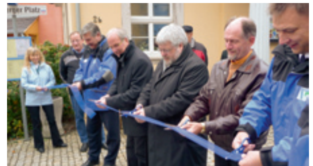
Das blaue Band wird durchgeschnitten, der Stadtverkehr eröffnet.

Die einheitlichen blauen Haltestellen, die differenzierten Tarife, die weitgehend vertakteten Fahrpläne und die optimierten Linienführungen bieten gute Voraussetzungen für die Bürger, mit dem Bus