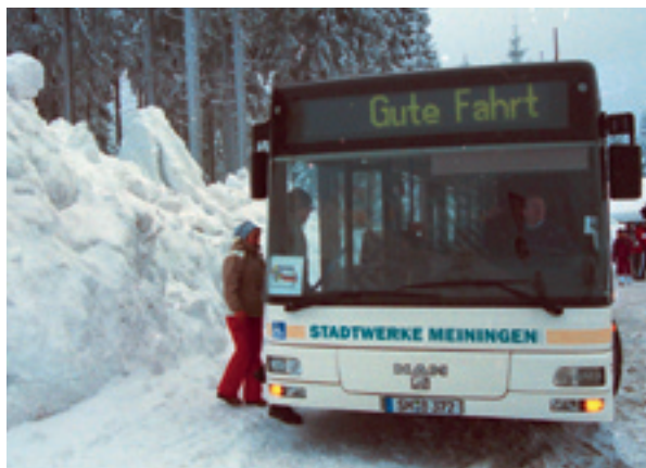
Mit dem Bus zur Skipiste im Thüringer Wald.