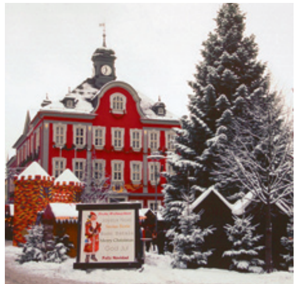
Suhl – Südthüringens größter Weihnachtsmarkt.

Altmarkt: 02.12.-20.12. Mo-Sa 10-19 Uhr So 13-19 Uhr Mittelalterlicher Weihnachtsmarkt auf Schloss Wilhelmsburg 05./06.12., 10-18 Uhr Die Fachwerkhäuser in der Schmalkalder Innenstadt bilden eine zauberhafte und stimmungsvolle Kulisse für den Herrscheklasmarkt. Höhepunkte sind der Herrscheklasumzug am 4. Dezember und der leuchtende Altmarkt am 11. Dezember. Auf Schloss Wilhelmsburg wird ein ritterliches Heerlager aufgeschlagen. Handwerker führen ihre traditionellen Gewerke vor. Märchenerzähler, Musik, Tanz und Theater sorgen für Unterhaltung.