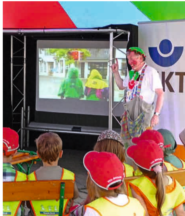
Die UKT engagiert einen Clown für die Jüngsten, damit sie spielerisch das Verhalten im Straßenverkehr kennenlernen.

Bei uns gingen im letzten Jahr exakt 2.927 Meldungen zu Schulwegunfällen ein. Darunter fallen genau 214 Unfälle in Bussen bzw. an Haltestellen. Das ist zum Glück sehr gering im Vergleich zur Zahl der beförderten Schülerinnen und