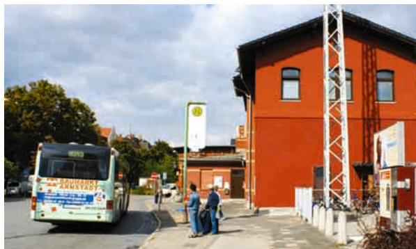
Um- und Einsteigen am Busbahnhof Arnstadt ins Gewerbegebiet Erfurter Kreuz.

In jüngster Zeit erreichten Anfragen die RBA, die Anbindung des Erfurter Kreuzes an den öffentlichen Nahverkehr spürbar zu erweitern und so für die Beschäftigten attraktiver zu machen. Deshalb wird die RBA ab dem 1. November 2010 die Linie 350/352 erweitern, zusätzliche Fahrten anbieten und zwei neue Haltestellen im Gewerbegebiet einrichten.