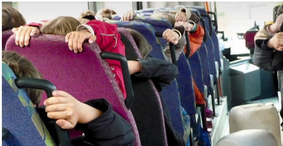
Vorführeffekt. Die Wasserbehälter, vergleichbar Schulranzen, fliegen bei 20 km/h durch den Bus.

► Jährlich nutzen über 100 Millionen Fahrgäste Linienbusse im Stadt- und Regionalverkehr in Thüringen. Sie setzen auf das sicherste Verkehrsmittel im ÖPNV.