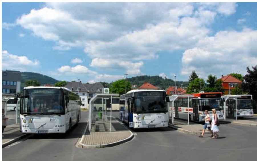
Vor der Abfahrt am Busbahnhof Ilmenau.

Diese Möglichkeiten der Information gelten auch generell für den neuen Fahrplan. Natürlich wird rechtzeitig das neue Fahrplanheft erscheinen. Es ist bei den Busfahrern, in den Servicestellen und Betriebshöfen von IOV und RBA erhältlich. ■